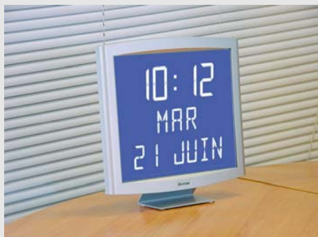
Opalys date sur support de table