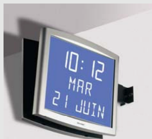
Opalys date sur support double face